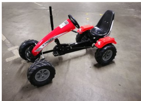
Eins von zwei Riesen-Go-Karts.

Auch neu im Verleih sind zwei große Go-Karts, die bis 100 kg belastbar sind. Die Größe beträgt 150x86x80 cm, das Gewicht liegt bei 50 kg. Der Verleih für Zwecke der Jugendarbeit ist kostenlos.