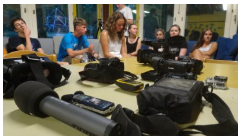
Medienpädagogik ist auch eine wichtige Aufgabe der Jugendarbeit

Der bayerische Jugendring hat ein Fachprogramm „Medienpädagogik“ aufgelegt.