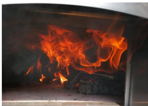
Aus dem Holzofen schmeckt die Pizza am Besten!