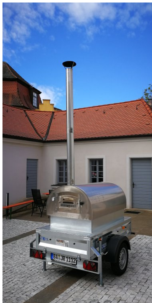
Der „lange Heinrich“.

Der Ofen wird für Zwecke der Jugendarbeit an entsprechende Verbände, Vereine und Initiativen gegen eine Gebühr von 25 € pro Wochenende bzw. 50 € pro Woche verliehen.