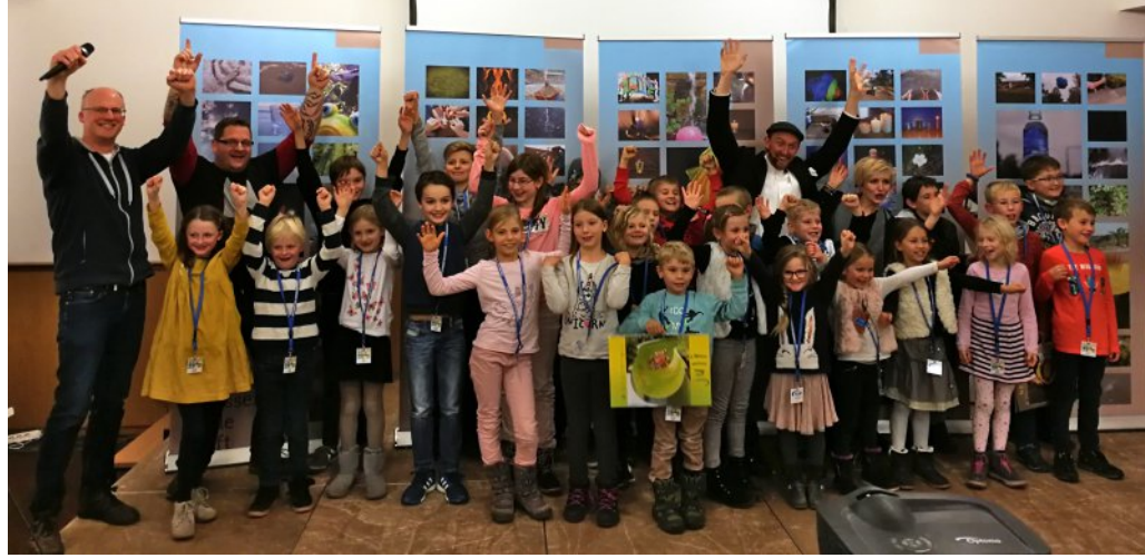
Beste Stimmung bei der Preisverleihung des Kinderfotopreises in Frensdorf.

jekten, die sich bei näherer Betrachtung als gekonnt beleuchtete Luftballons entpuppten, die mit farbigem Wasser bespritzt waren. Ebenso gab es witzige Einfälle, wie das Foto „Vier in einem Element“, das vier Kinder in der Riesenrutsche zeigt. Aber auch geradezu meditative Fotos wurden eingereicht, die die beruhigende Wirkung von fließendem Wasser eindrucksvoll zeigen.