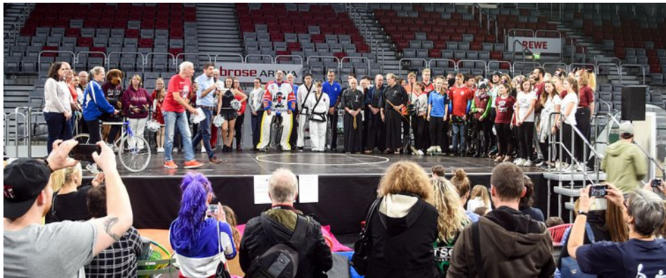
Wieder über 20 Sportvereine beim 9. Bamberger Tag des Sports!

Das „Who is Who“ der Bamberger Sportwelt gab sich am 24. November in der BROSE ARENA die Klinke in die Hand: Beim 9. Bamberger Tag des Sports präsentierten sich über 20 Sportvereine und Institutionen einer breiten Öffentlichkeit und luden unter dem Motto „Finde Deinen Sport“ zum Mitmachen und Ausprobieren ein. Organisiert wurde die Mitmachveranstaltung gemeinschaftlich von Kreisjugendring, Brose Bamberg e.V. und Innovative Sozialarbeit e.V..