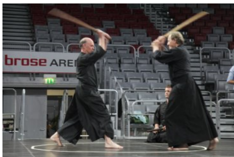
Neu dabei: Aikikai.

Neben klassischen Sportarten wie Basketball oder Hockey konnte das Familienevent in diesem Jahr erneut mit neuen Teilnehmern aufwarten: Neben Roller Derby – ein Mix aus Rugby und Rollschuhfahren – sorgte auch der Verein Aikikai mit seiner Schwertkunst für große Augen.