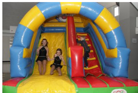
Beliebt bei Klein und Groß: das KJR-Kinderland.

Wer hoch hinaus wollte, kam beim Turnen, Baseball und besonders beim Aero Club Bamberg auf seine Kosten. Mit dem KJR-Kinderland inklusive Hüpfburg sowie