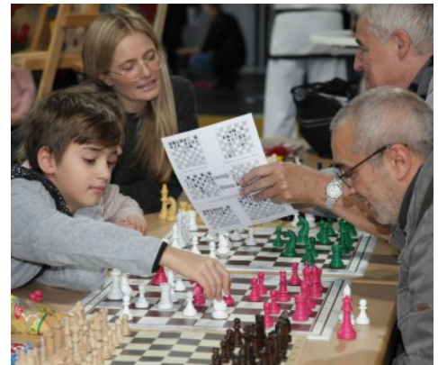
Ja, auch Schach ist eine Sportart!