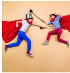
AUFSICHTSPFLICHT Aufsichts- und Verantwortungsregeln in Jugendarbeit