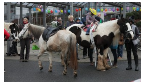
Auch die Pferde waren heiß begehrt.

2019 erwartet das Orga-Team dann ein ganz besonderes Jahr: die Familien- und Vereinsmesse feiert ihr zehnjähriges Jubiläum.